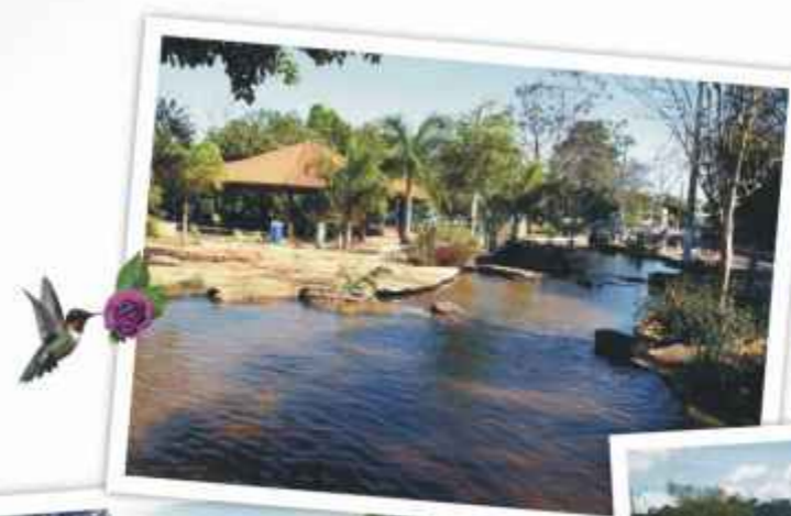
Cascata, piscina de água corrente, belos lagos e muito verde.

O conjunto hidrográfico do Parque do Sabiá é de rara beleza. São 3 nascentes totalmente preservadas, com vegetação natural. Elas abastecem 7 represas e originam 8 lagos distribuídos ao longo do bosque. As duas piscinas do parque também são abastecidas com água limpa e corrente das nascentes.