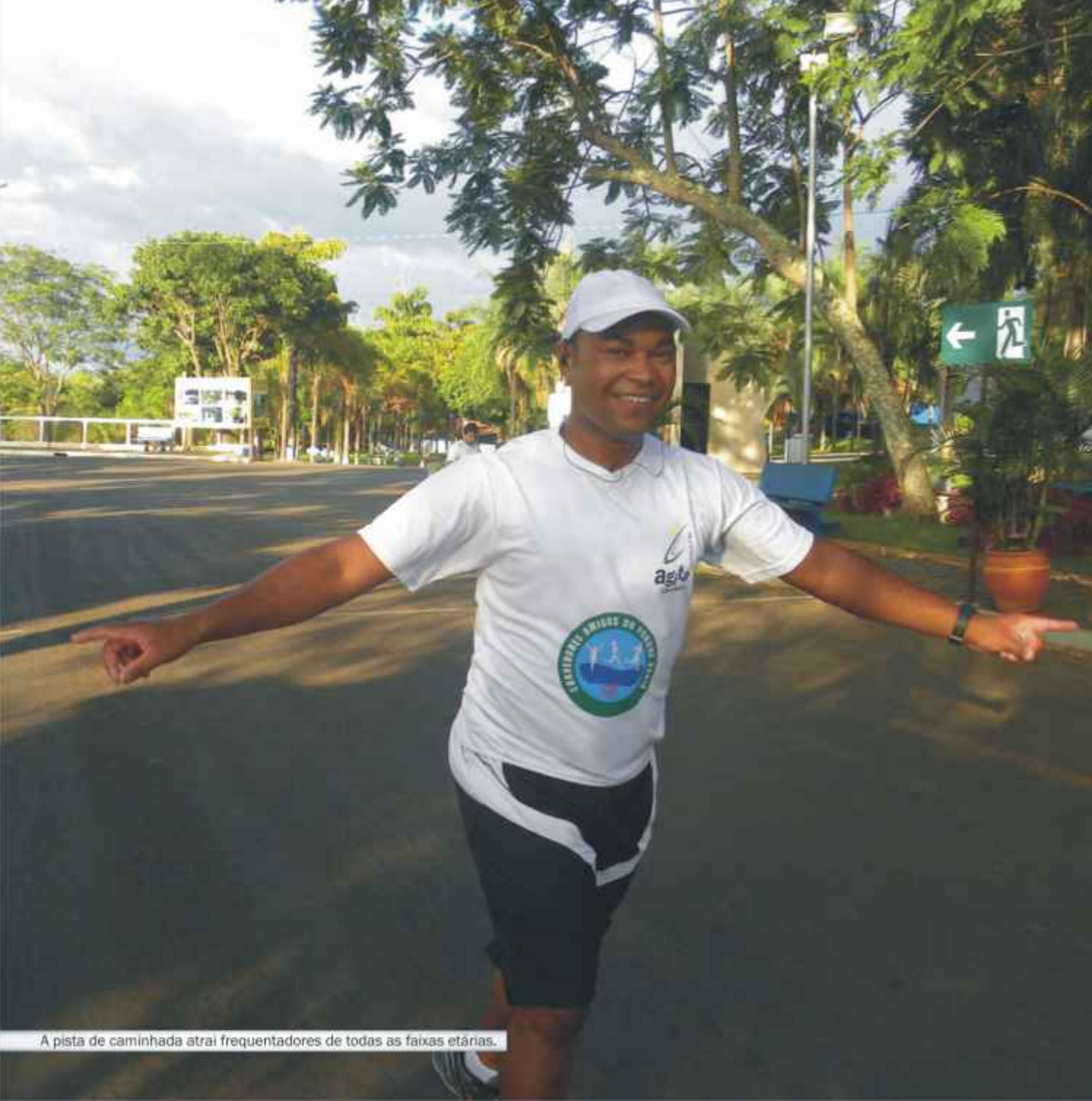
A pista de caminhada atrai frequentadores de todas as faixas etárias.