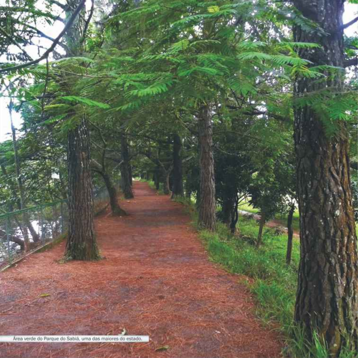
Área verde do Parque do Sabiá, uma das maiores do estado.