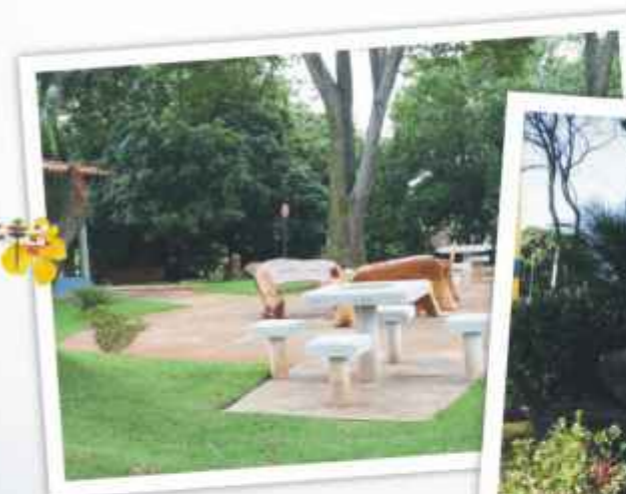
Lazer e tranquilidade

Inaugurado em 1982, o Parque é, desde então, o principal ponto turístico de Uberlândia e o local preferido da população, onde as pessoas se encontram, se divertem, praticam esportes e vivem momentos de intensa felicidade!