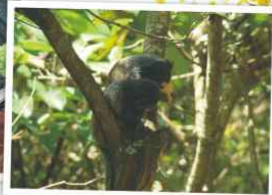
Bosque Lady Lene: proteção para diversas espécies.