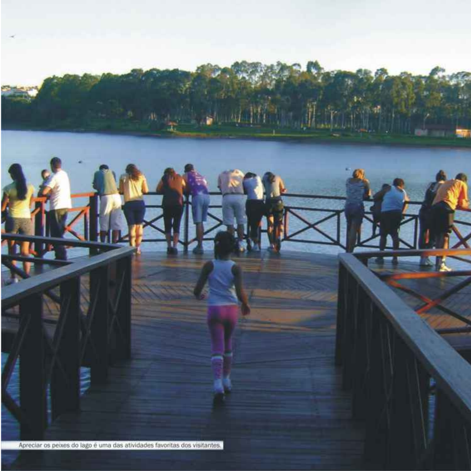
Apreciar os peixes do lago é uma das atividades favoritas dos visitantes.