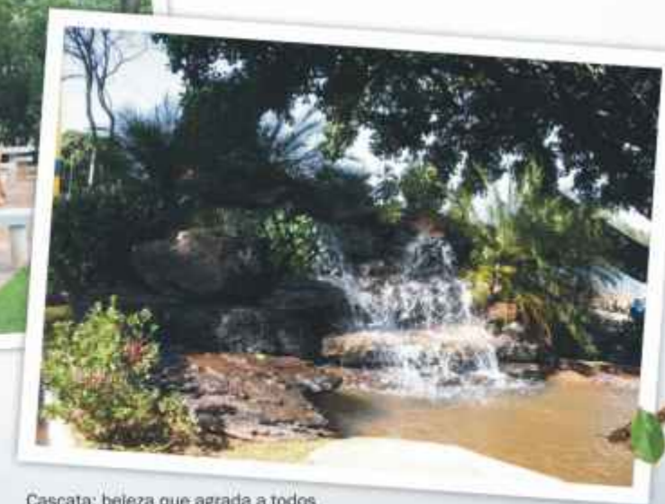
Cascata: beleza que agrada a todos.