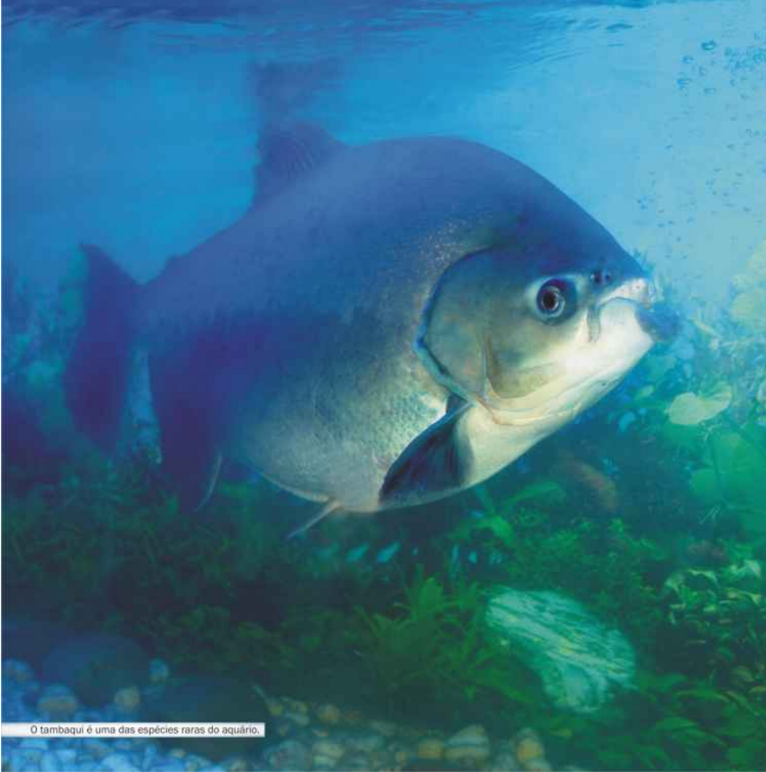
O tambaqui é uma das espécies raras do aquário.