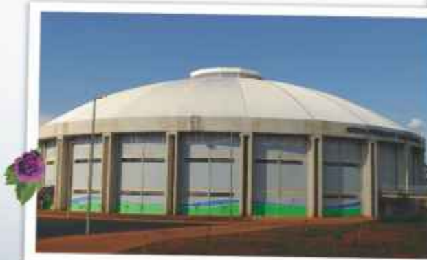
Sabiazinho: uma arena esportiva multiuso, moderna e completa.

Com capacidade para 7.650 lugares (6 mil sentados), possui quadra poliesportiva, tribuna de honra, sala de imprensa, bar, lanchonete, sanitários, alojamentos e vestiários. O ginásio conta com uma moderna arquitetura, com departamento médico, almoxarifado, setor administrativo, academia, salas de aula, espaços para exposições e um amplo estacionamento . Possui ainda um sistema de monitoramento com câmeras, elevador para portadores de necessidades especiais e completo serviço de jardinagem.