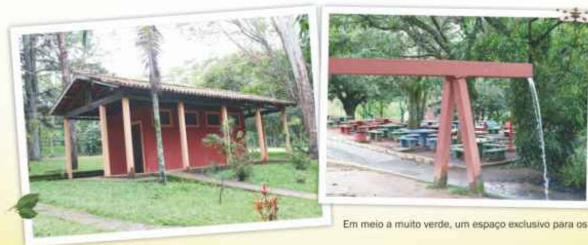
Em meio a muito verde, um espaço exclusivo para os idosos.

A terceira idade também tem um espaço só seu: é o Recanto do Idoso, um ótimo local dentro do Parque para recreação e contemplação da natureza.