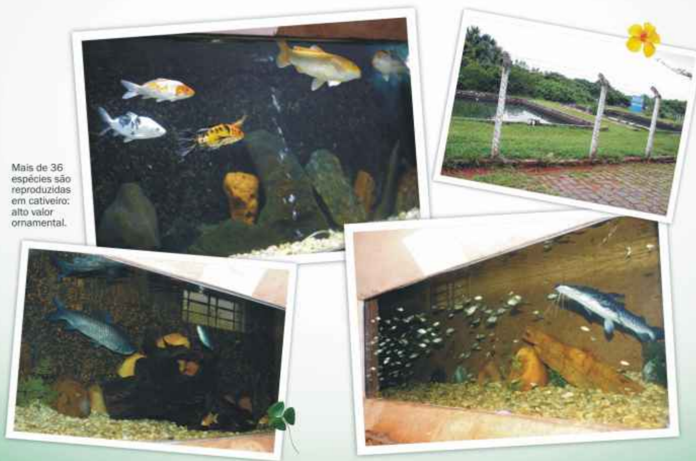
Mais de 36 espécies são reproduzidas em cativeiro: alto valor ornamental.