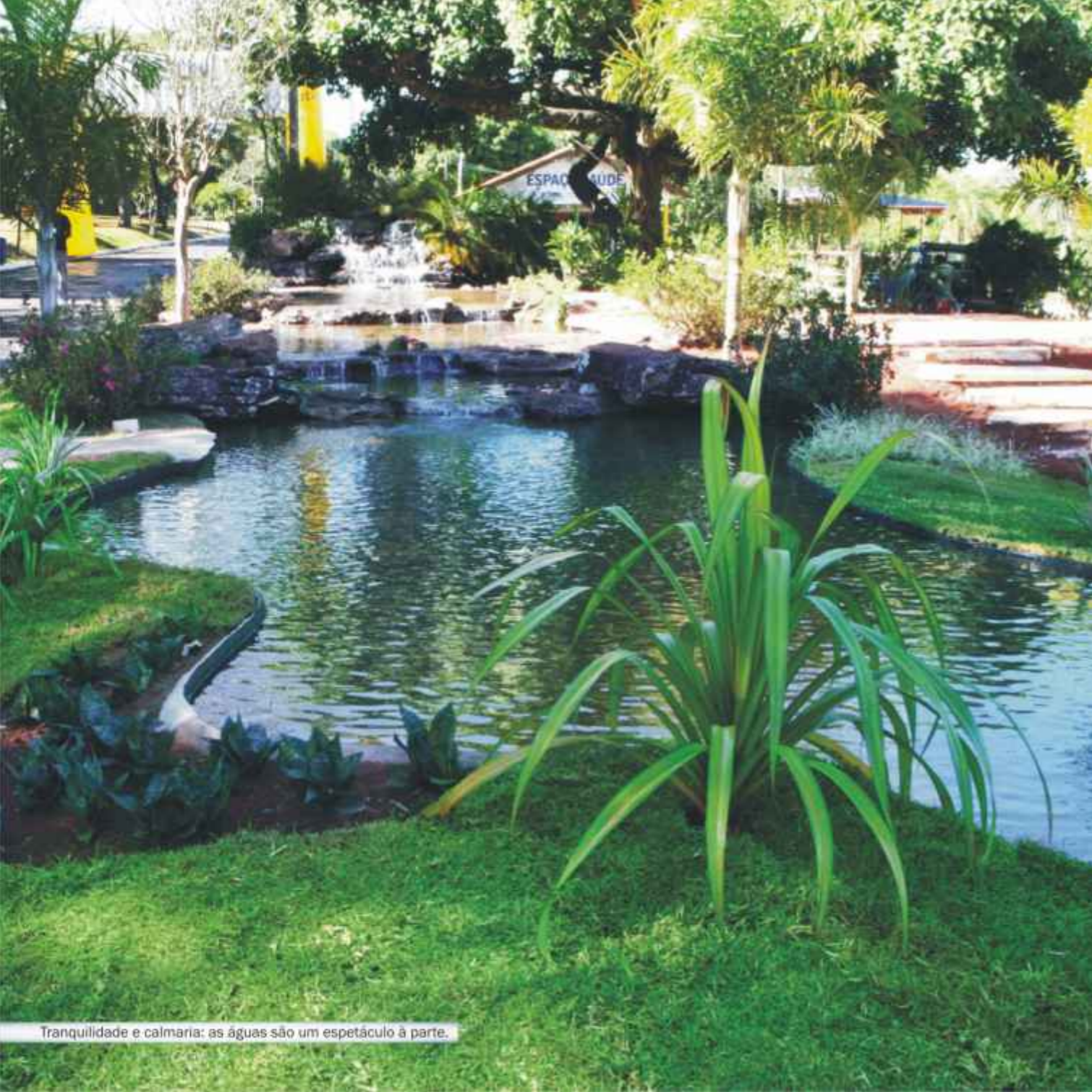
Tranquilidade e calma: as águas são um espetáculo à parte.