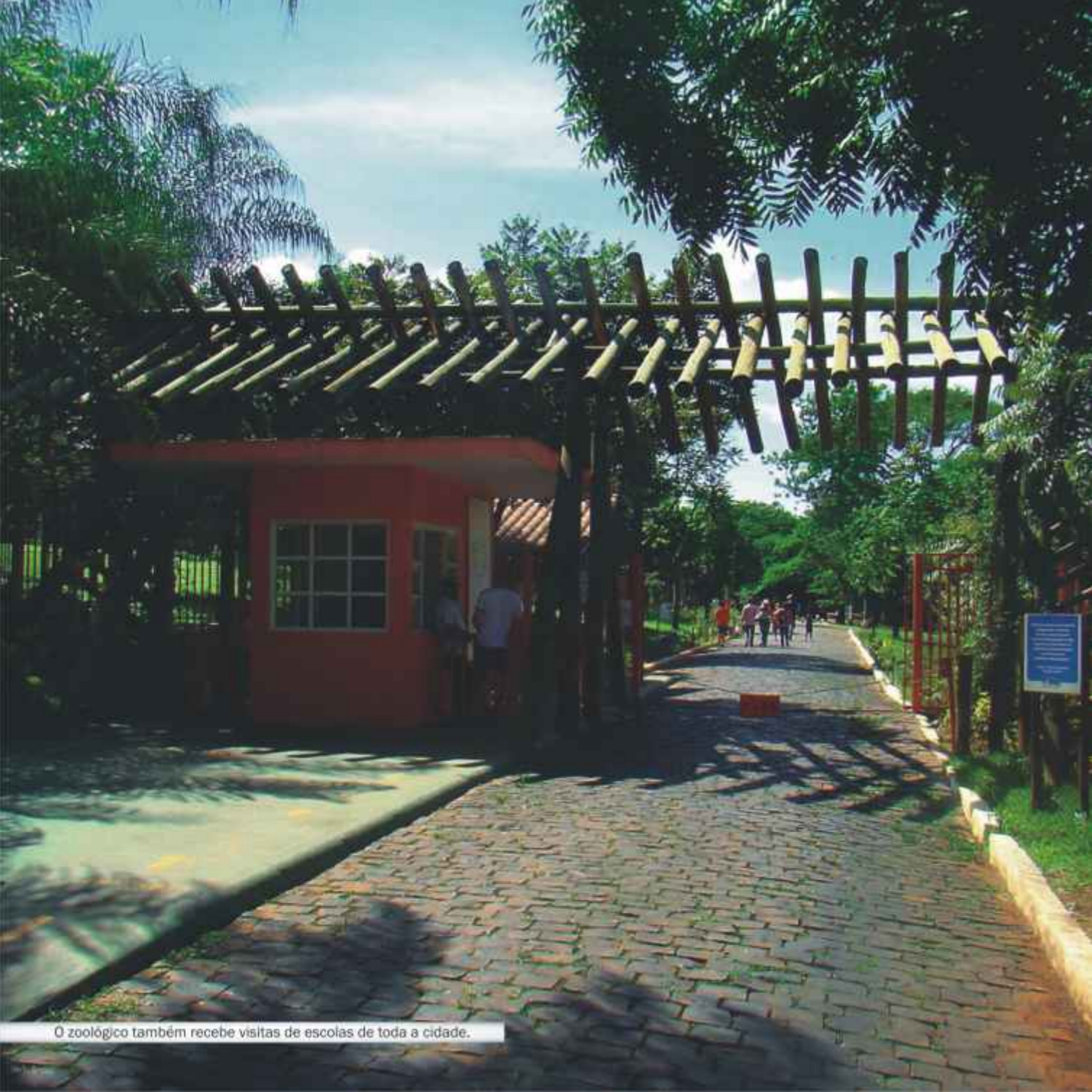
O zoológico também recebe visitas de escolas de toda a cidade.