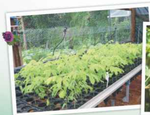
Viveiro Lady Lene: produção de mudas raras

Frequentemente os biólogos desenvolvem ações de controle ambiental para garantir a proteção desta imensa reserva verde. E o Parque conta ainda com um Centro de Educação Ambiental que, por meio de palestras, vídeos, cursos e apresentações teatrais, divulga a importância da preservação do meio ambiente.