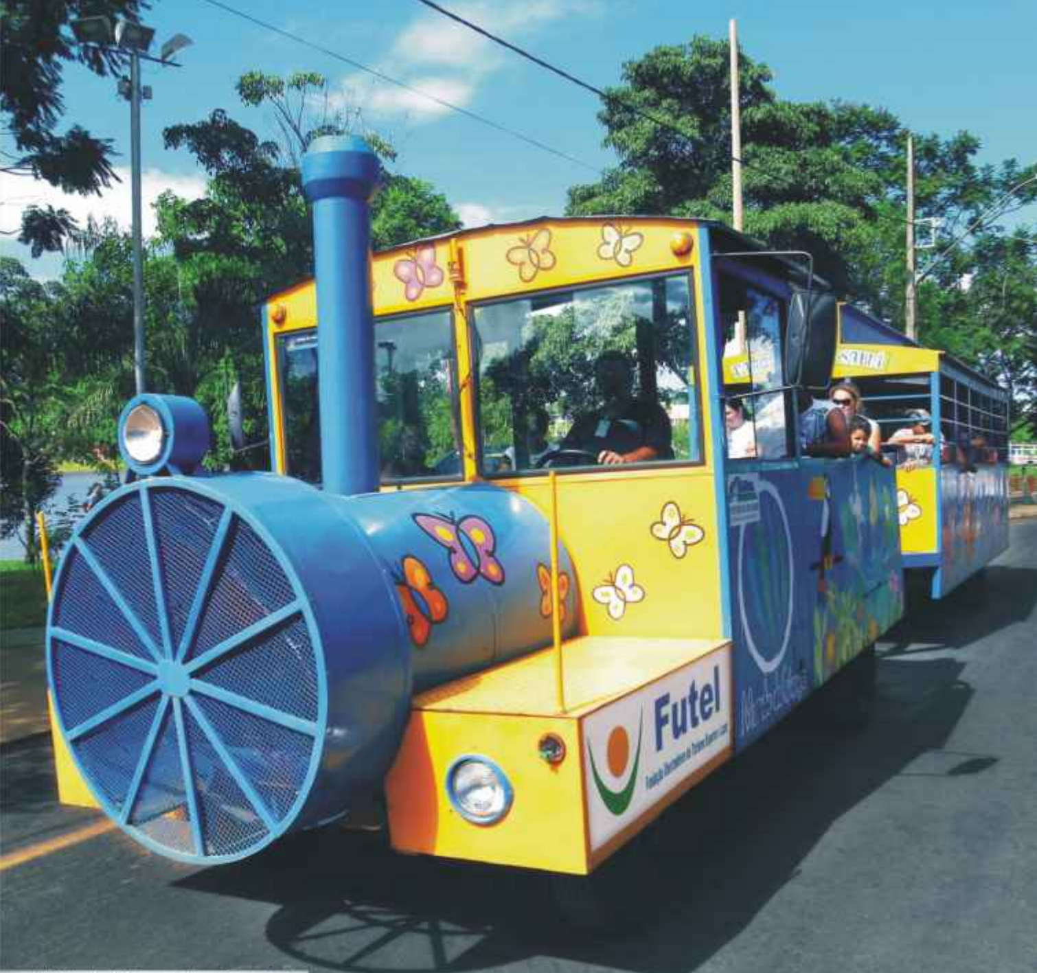
No Mundo da Criança, diversão à vontade.