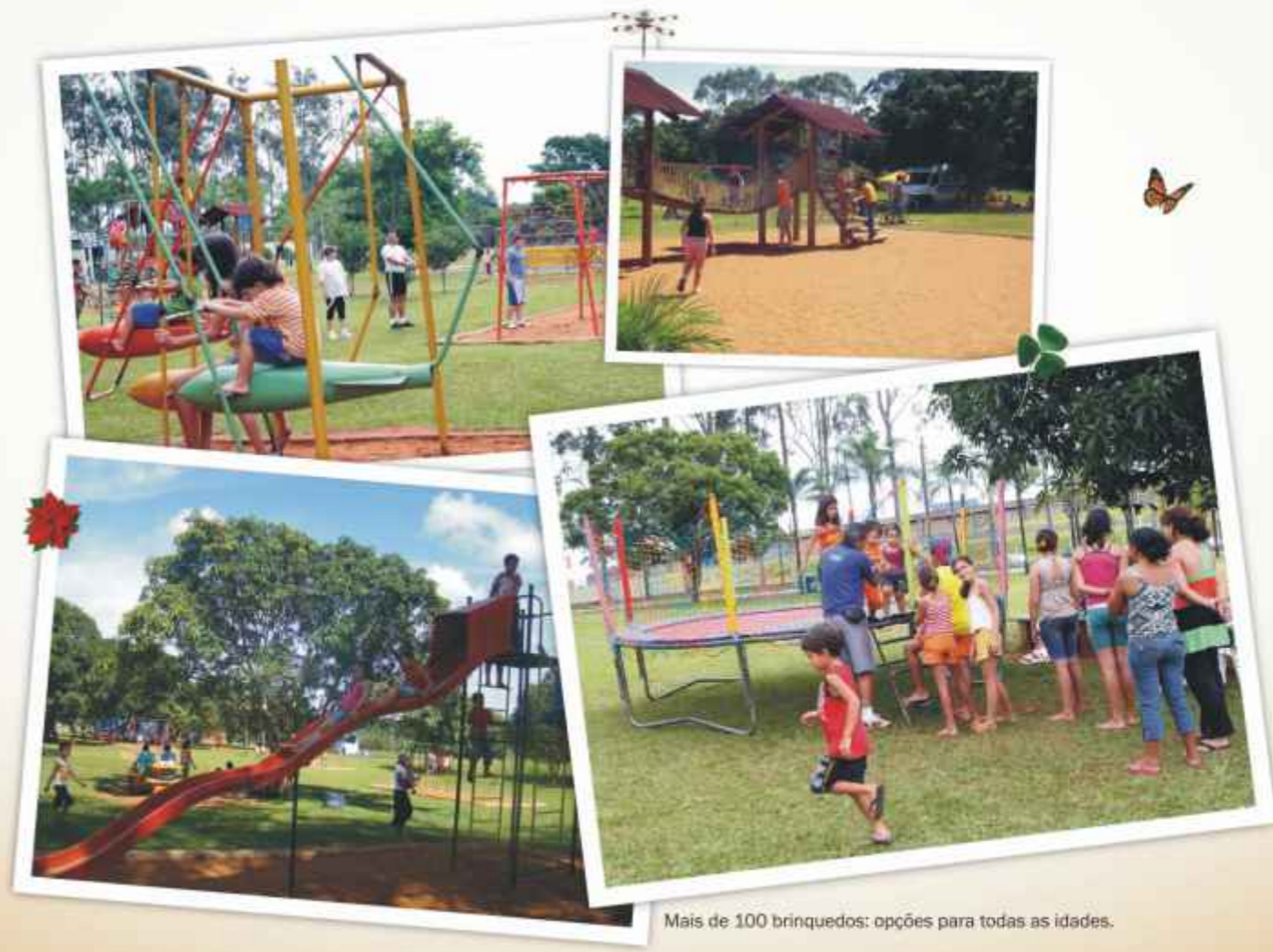
Mais de 100 brinquedos: opções para todas as idades.

No Parque do Sabiá, criança é sinônimo de lazer. E a garotada tem um local só delas - é o "Mundo da Criança" - um completo parque infantil com mais de 100 brinquedos , onde elas esbanjam alegria e gastam muita energia brincando. E tem até trenzinho que as transporta para conhecer todas as belezas do Parque.